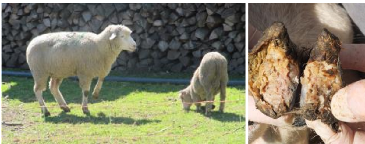
Figuur 1 & 1 Links een ooi en lam, beide met rotkreupel. De ooi vermijdt te steunen op de aangetaste klauw, linksvoor. Het lam steunt op de knieën om niet te moeten steunen op de aangetaste voorpoten. Rechts een erg aangetaste klauw waar er sprake van ondermijning is.

Opmerkelijk is dat er een groot verschil is tussen de perceptie van de schapenhouder en de werkelijke aanwezigheid van rotkreupel. Uit studies, o.a. in Engeland en Nederland, blijkt dat bijna de helft van de schapenhouders in hun kuddes last heeft van rotkreupel, maar bij enquêtes geeft maar 1 schaaphouder op 4 aan dat hij/zij last heeft van rotkreupel in zijn/haar kudde. M.a.w. rotkreupel is een zeer besmettelijke en deels subklinische aandoening die productieverliezen met zich meebrengt.